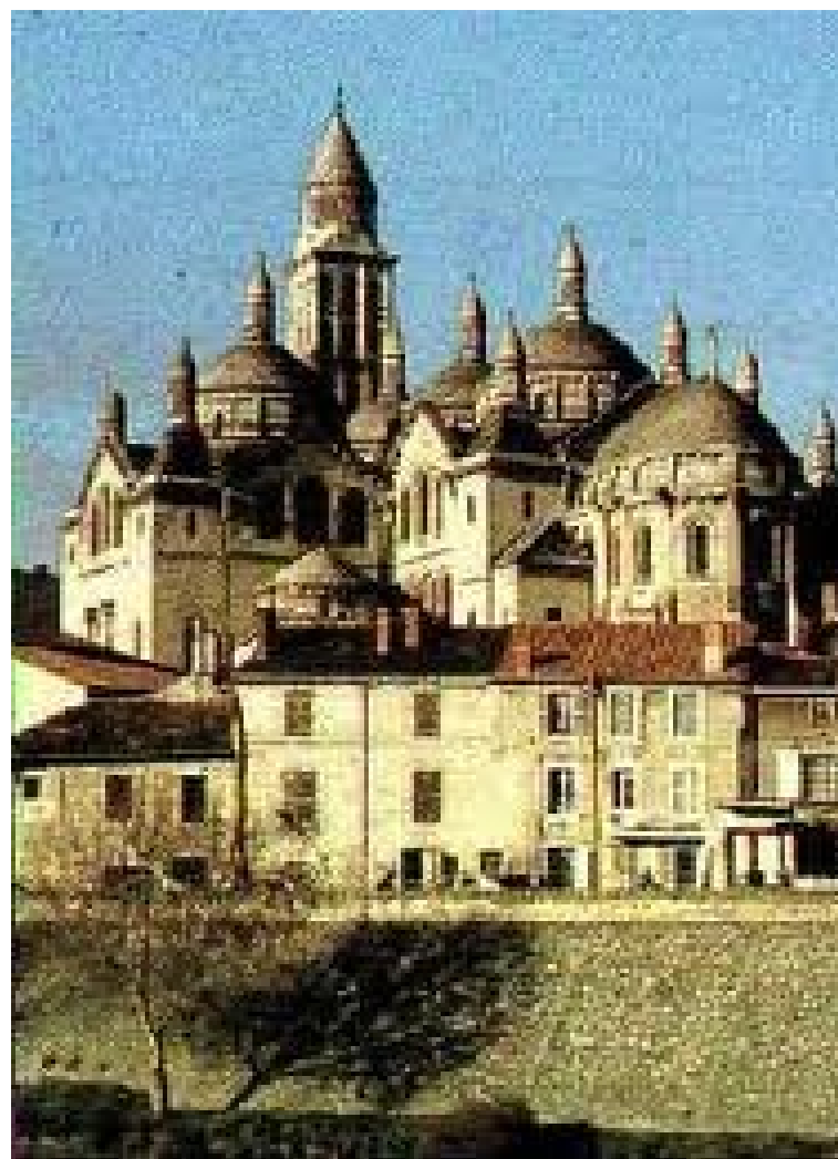
Sant Francesc amb la regla del 3rç orde a la catedral de Perigeux